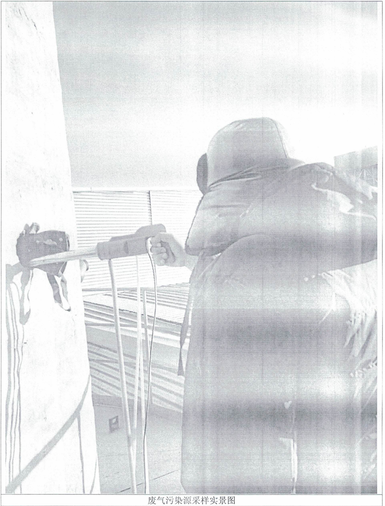
废气污染源采样实景图